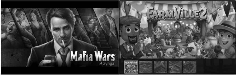
Figure 4. Jeux emblématiques de la société Zynga : des extensions du dispositif initial