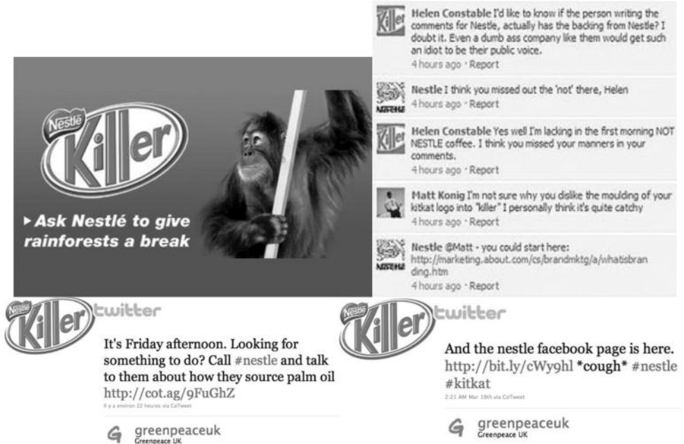
Figure 3. Campagne de Greenpeace contre Nestlé (extraits issus de Twitter et Facebook)

zaines de milliers d'applications, telle que « anniversaire », qui rappelle les dates de naissance de ses proches, c'est aussi le cas des entreprises qui ont saisi l'opportunité de s'inscrire dans le dispositif Facebook avec des applications allant de la simple opération promotionnelle (ex. pots de Nutella virtuels) au développement de nouveaux services en ligne (de musique, géolocalisation, partage de photos, vidéos, etc.), en passant par les jeux en ligne tel que Candy Crush, exemple typique d'extension menée par une entreprise. L'intégration de ces nouveaux services et applications au sein de Facebook apparaît d'ailleurs comme un facteur de développement à la fois pour Facebook et pour Zynga.